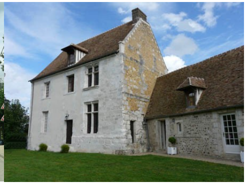
La façade sud du manoir (vue proche) La façade sud du manoir (vue éloignée)